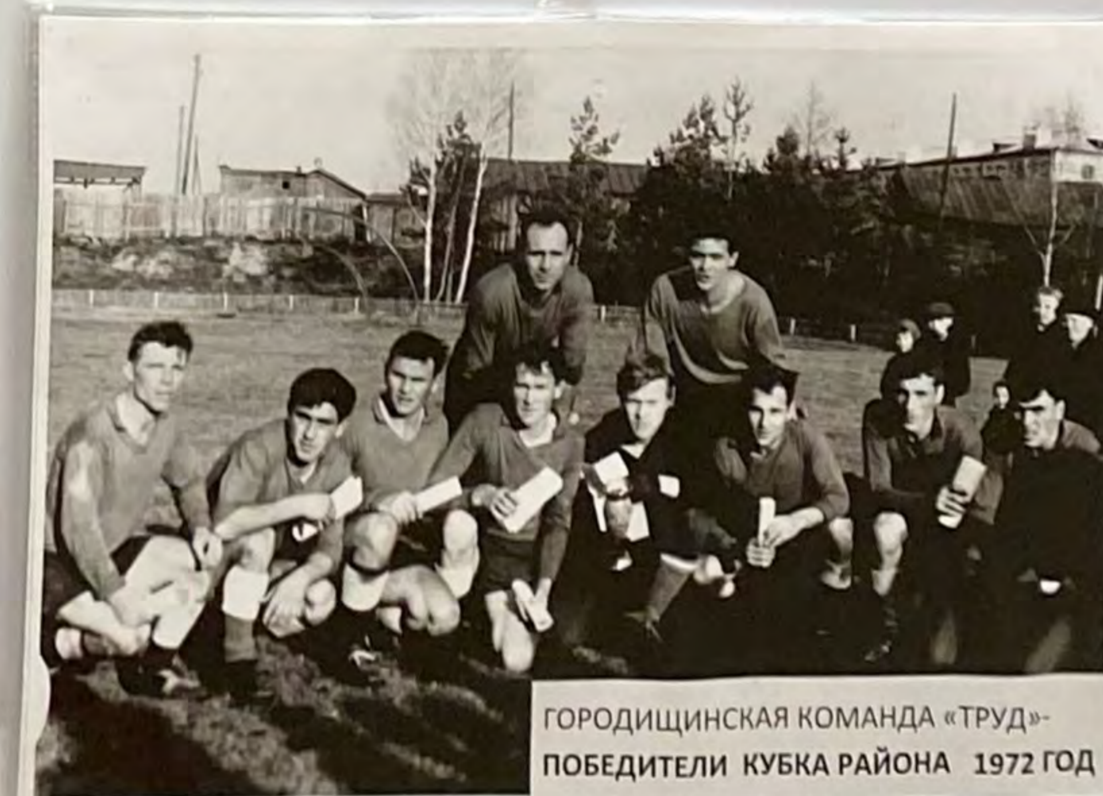
ГОРОДИЩИНСКАЯ КОМАНДА «ТРУД»- ПОБЕДИТЕЛИ КУБКА РАЙОНА 1972 ГОД