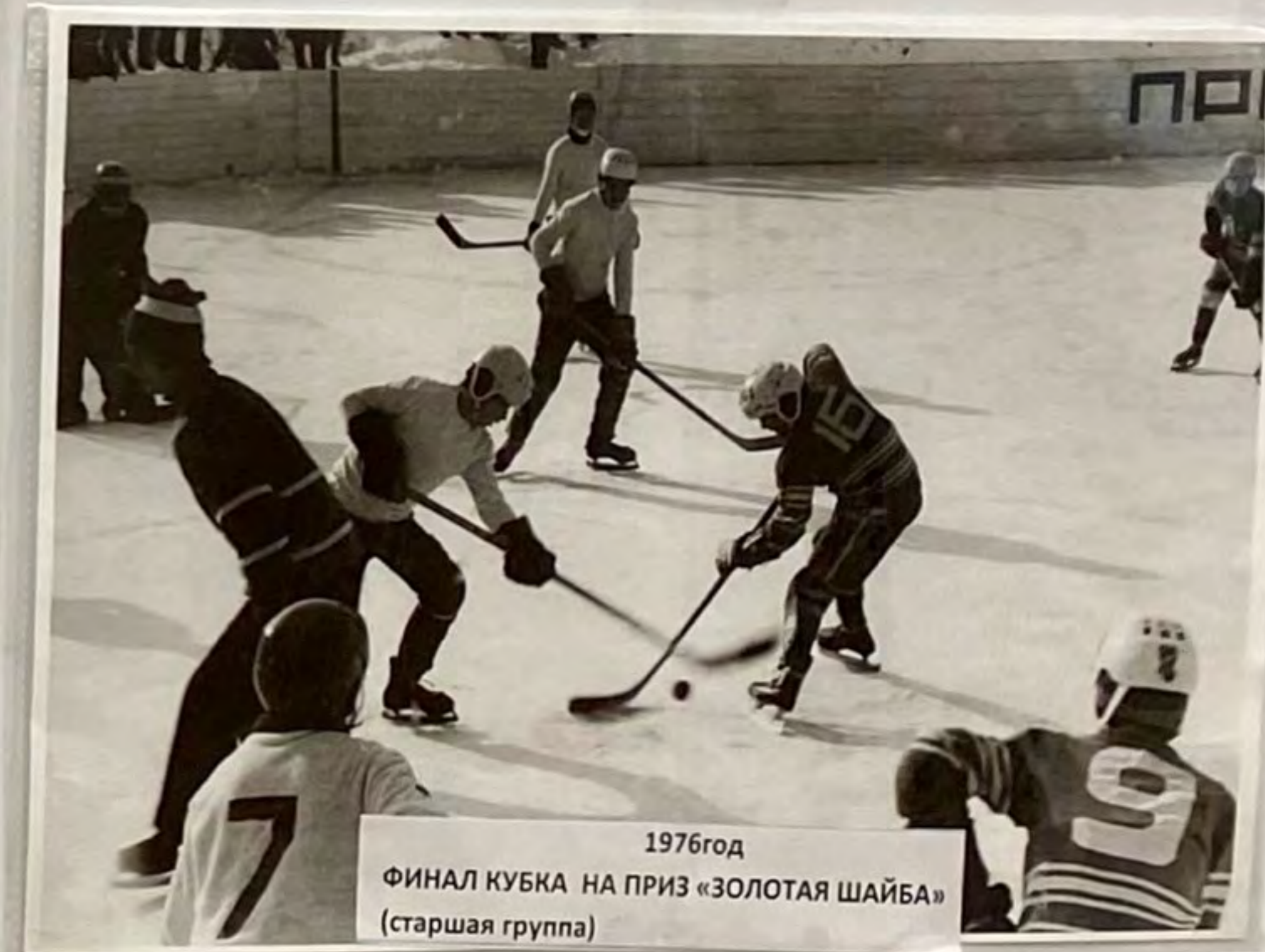
1976год ФИНАЛ КУБКА НА ПРИЗ «ЗОЛОТАЯ ШАЙБА» (старшая группа)