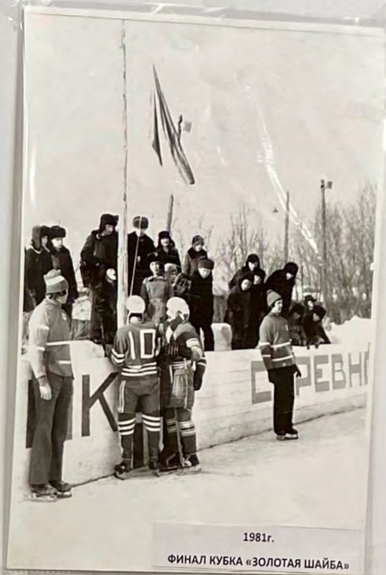
1981г. ФИНАЛ КУБКА «ЗОЛОТАЯ ШАЙБА»