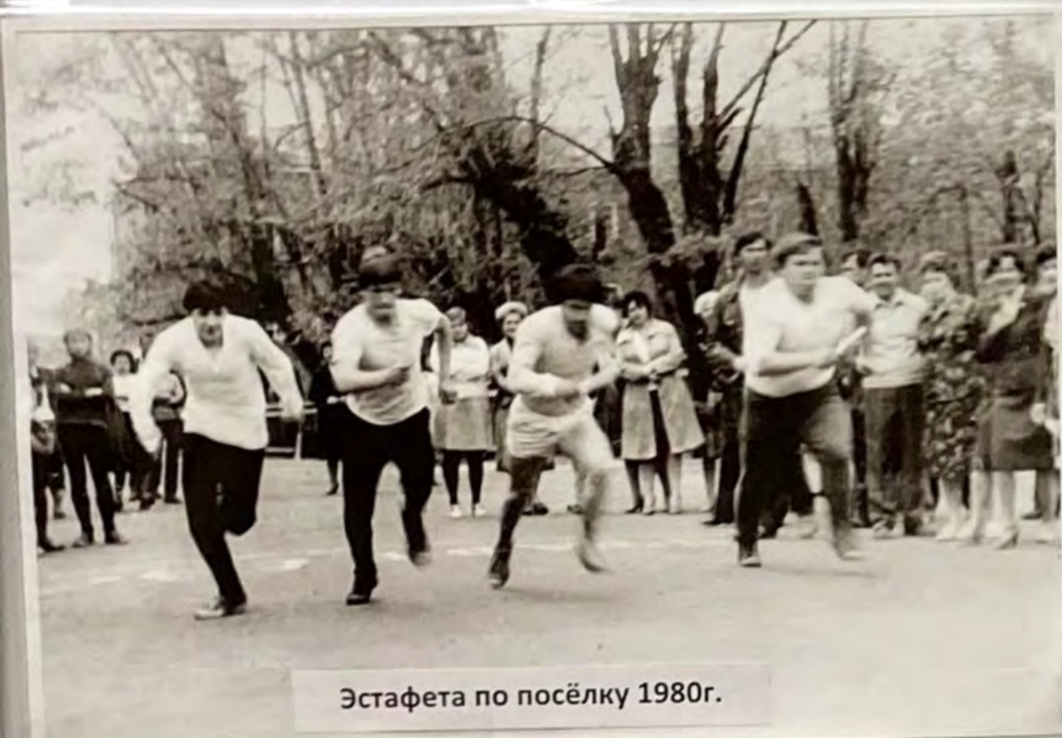
Эстафета по посёлку 1980г.