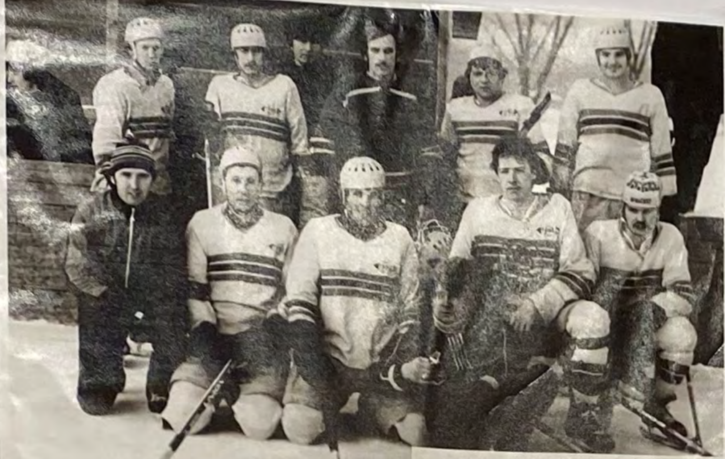
1980 г. КОМАНДА ХОККЕИСТОВ ПОС.ГОРОДИЦЫ