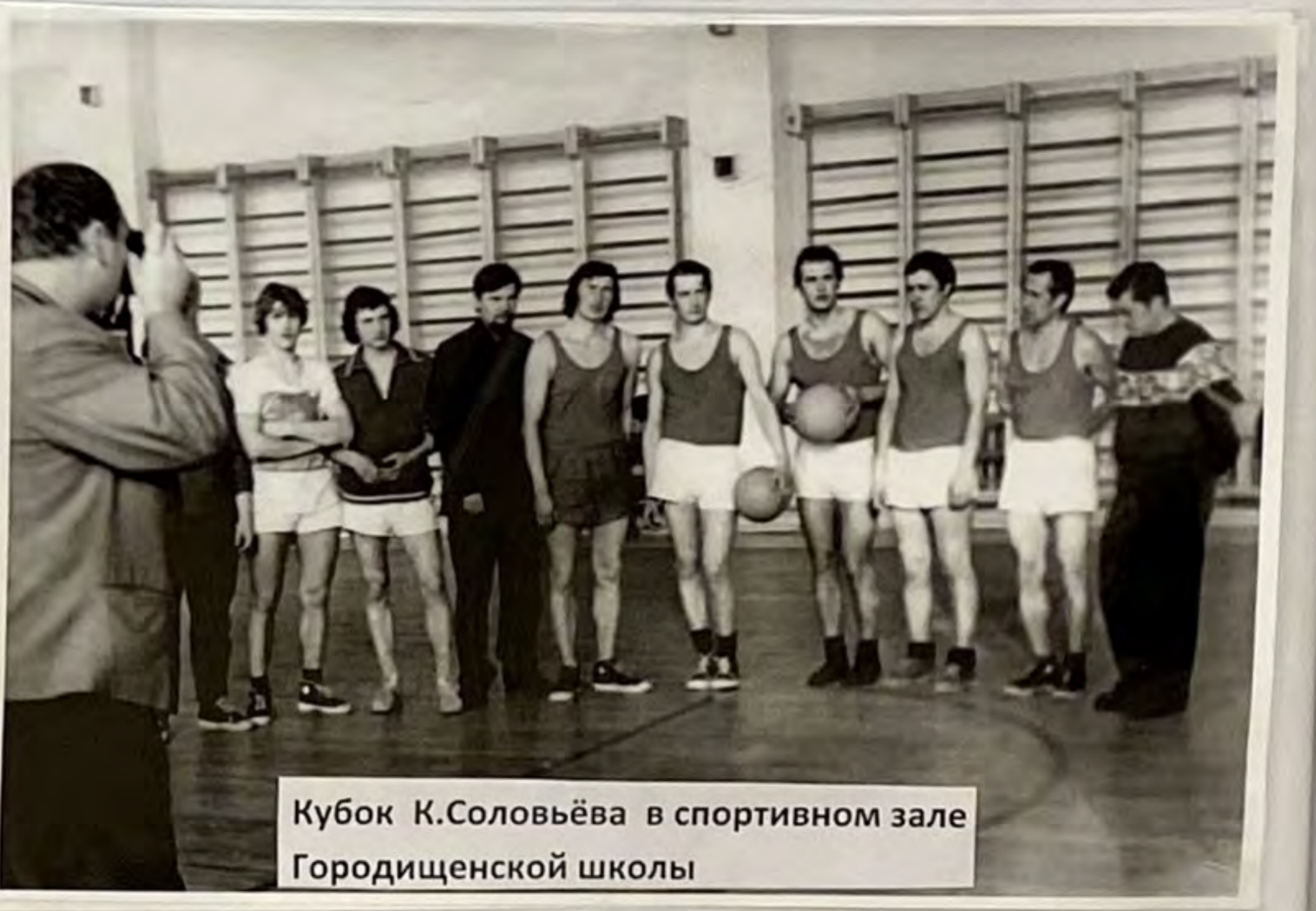
Кубок К.Соловьёва в спортивном зале Городищенской школы