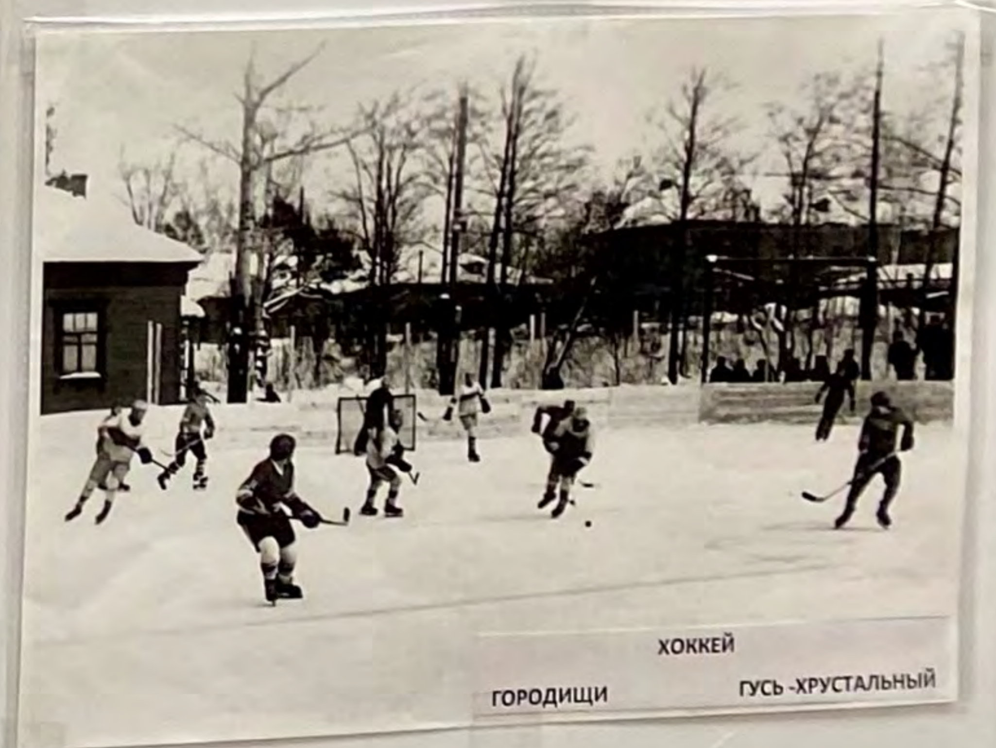
ХОККЕЙ ГОРОДИЦЫ ГУСЬ -ХРУСТАЛЬНЫЙ