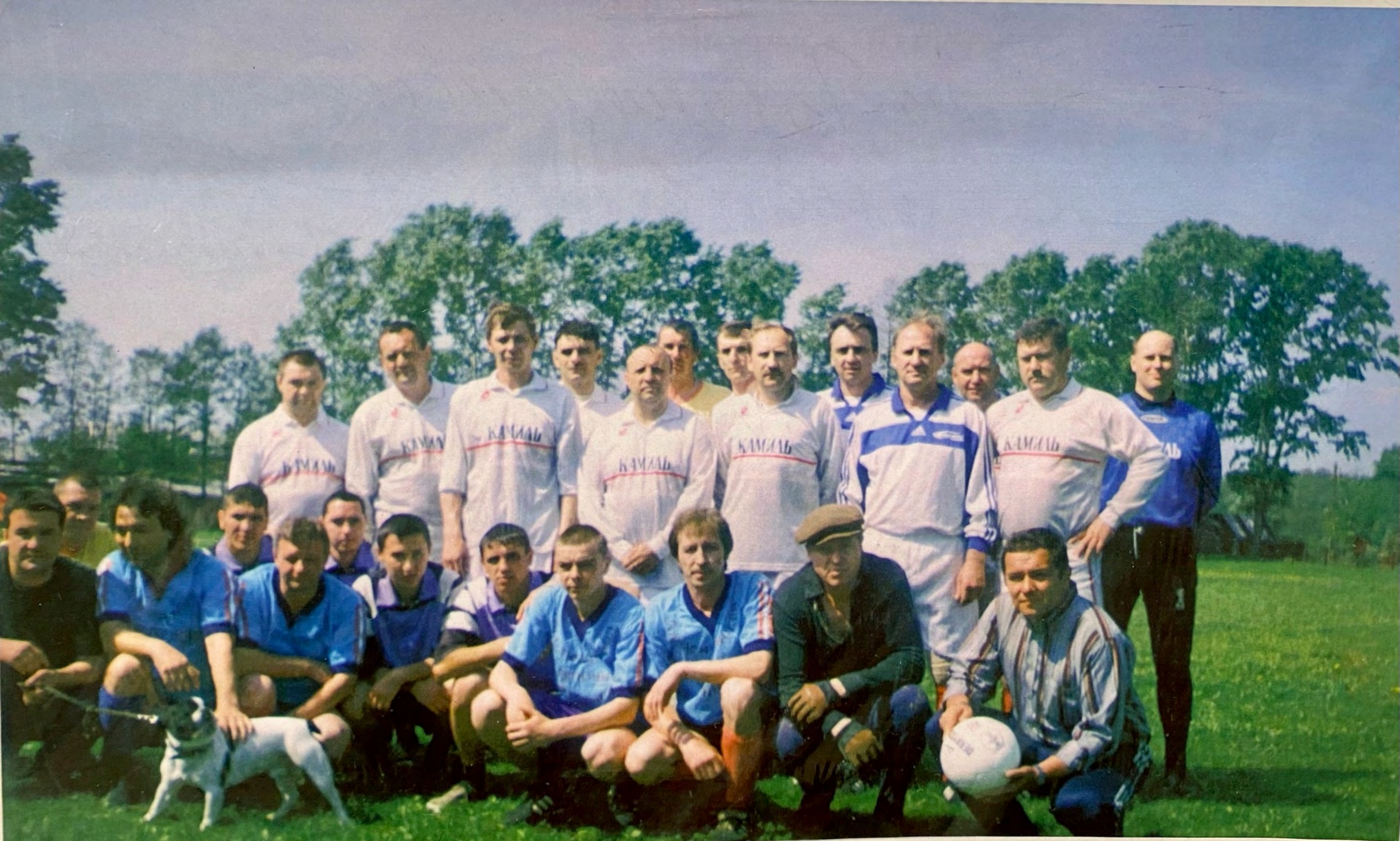
НА СТАДИОНЕ ПОС. ГОРОДИЩИ ВЕТЕРАНЫ ФУТБОЛА МОСКОВСКОЕ «ДИНАМО» И СБОРНАЯ КОМАНДА П. ГОРОДИЩИ