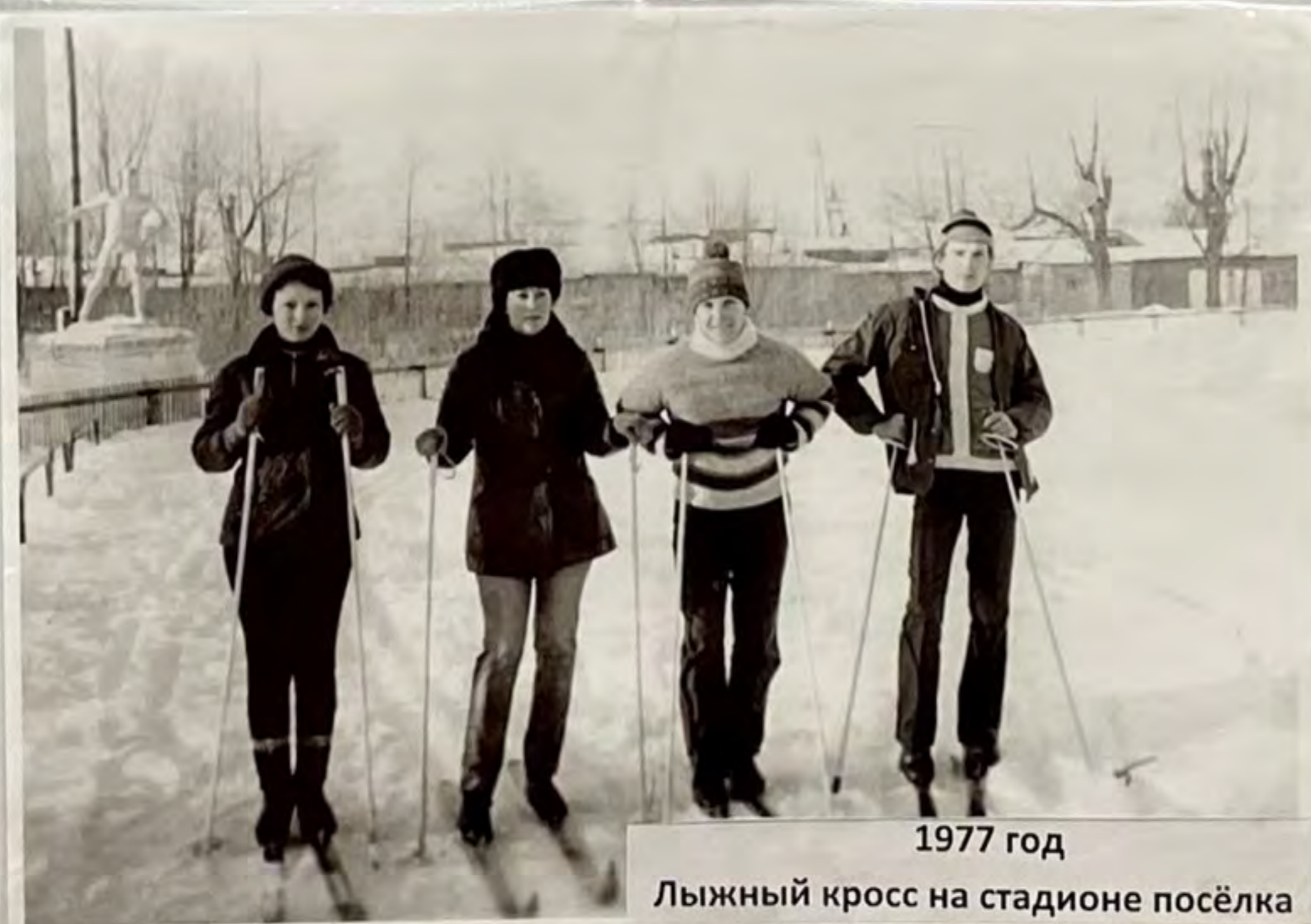
1977 год Лыжный кросс на стадионе посёлка