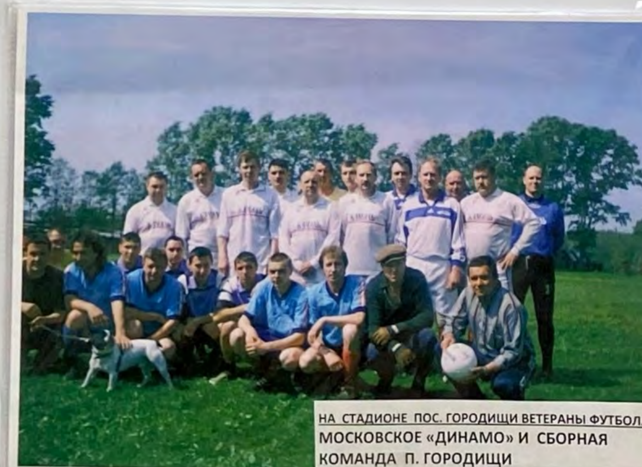
НА СТАДИОНЕ ПОС. ГОРОДИЩИ ВЕТЕРАНЫ ФУТБОЛА МОСКОВСКОЕ «ДИНАМО» И СБОРНАЯ КОМАНДА П. ГОРОДИЩИ