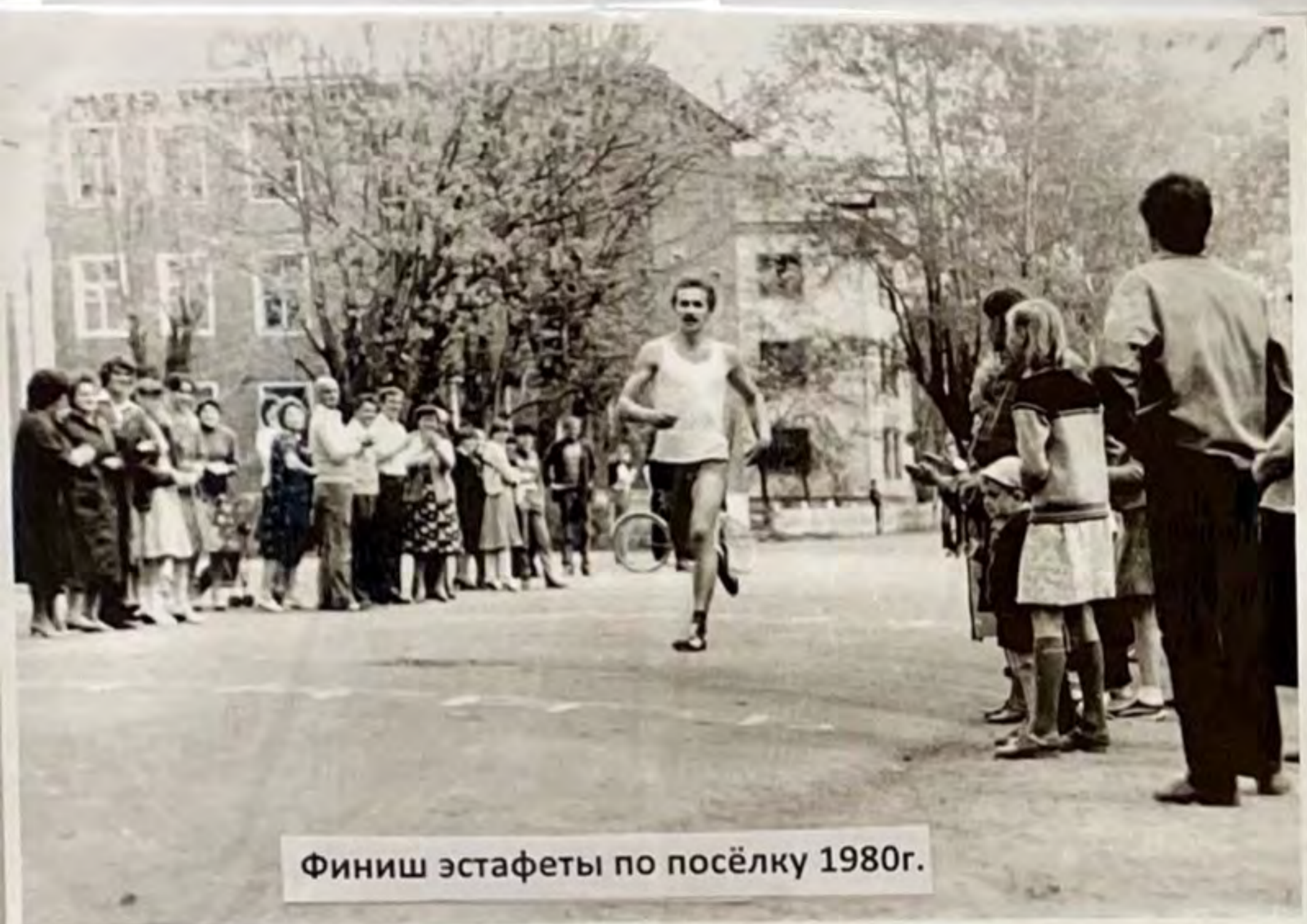
Финиш эстафеты по посёлку 1980г.