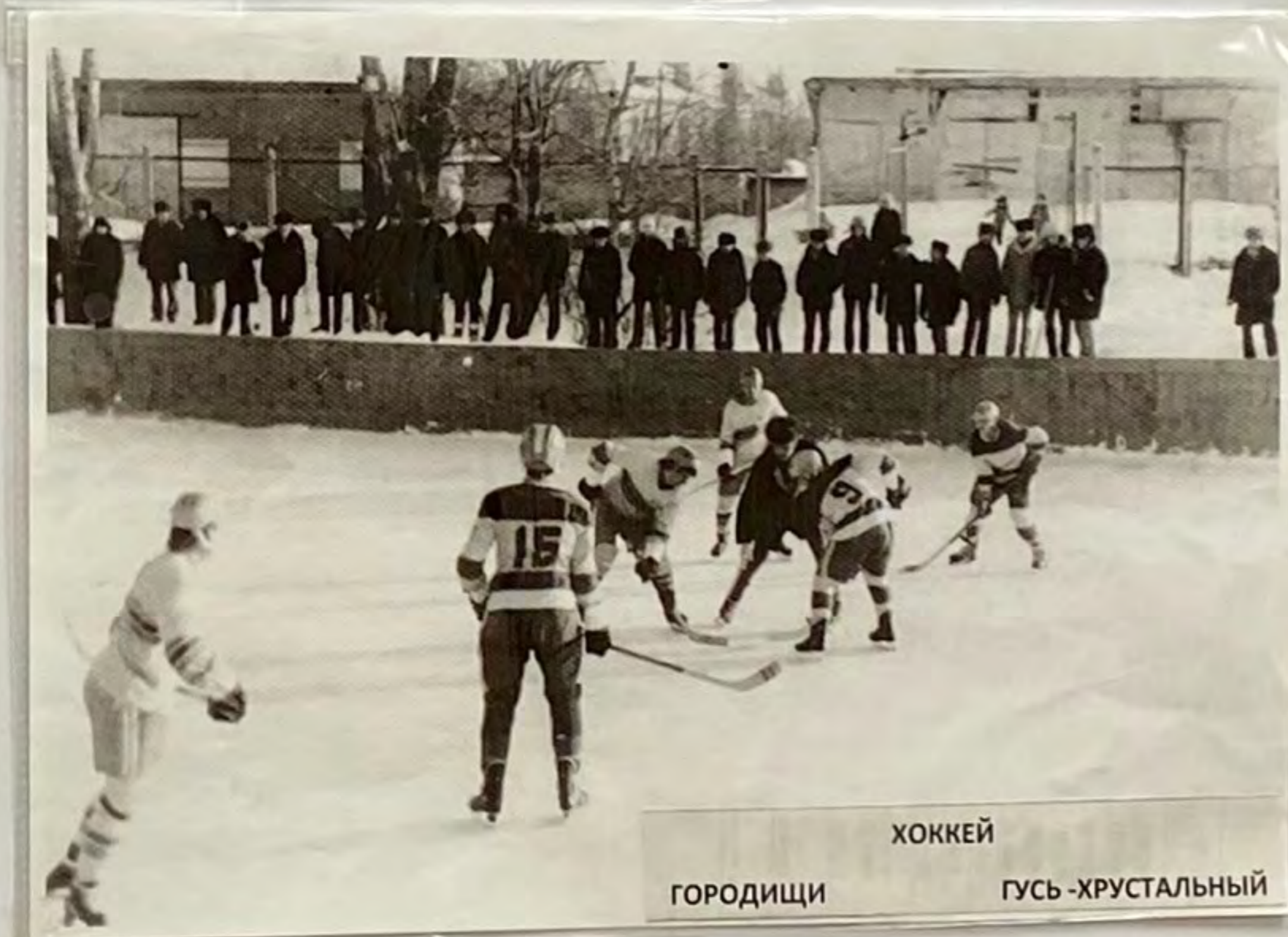
ХОККЕЙ ГОРОДИЦЫ ГУСЬ -ХРУСТАЛЬНЫЙ