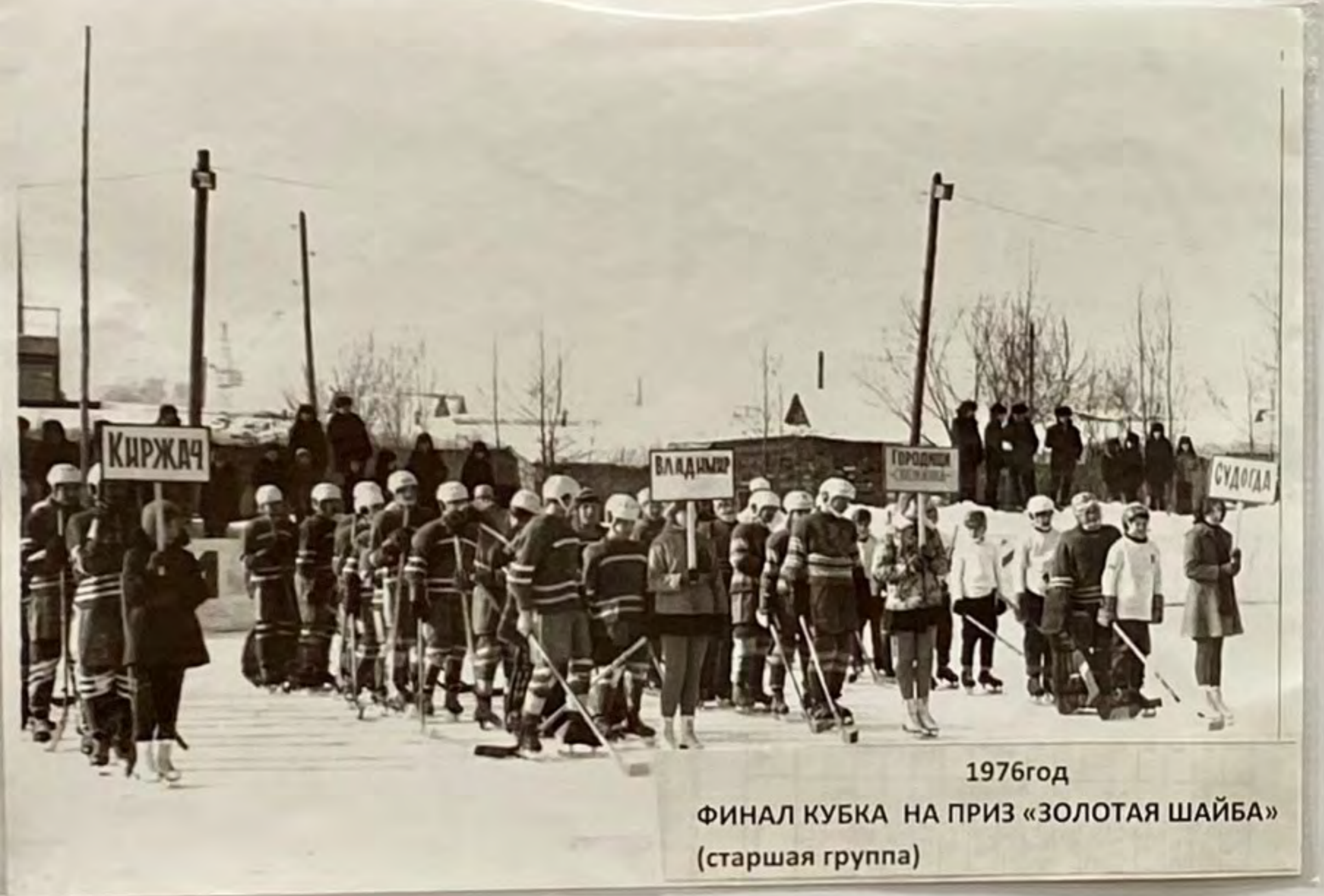
1976год ФИНАЛ КУБКА НА ПРИЗ «ЗОЛОТАЯ ШАЙБА» (старшая группа)