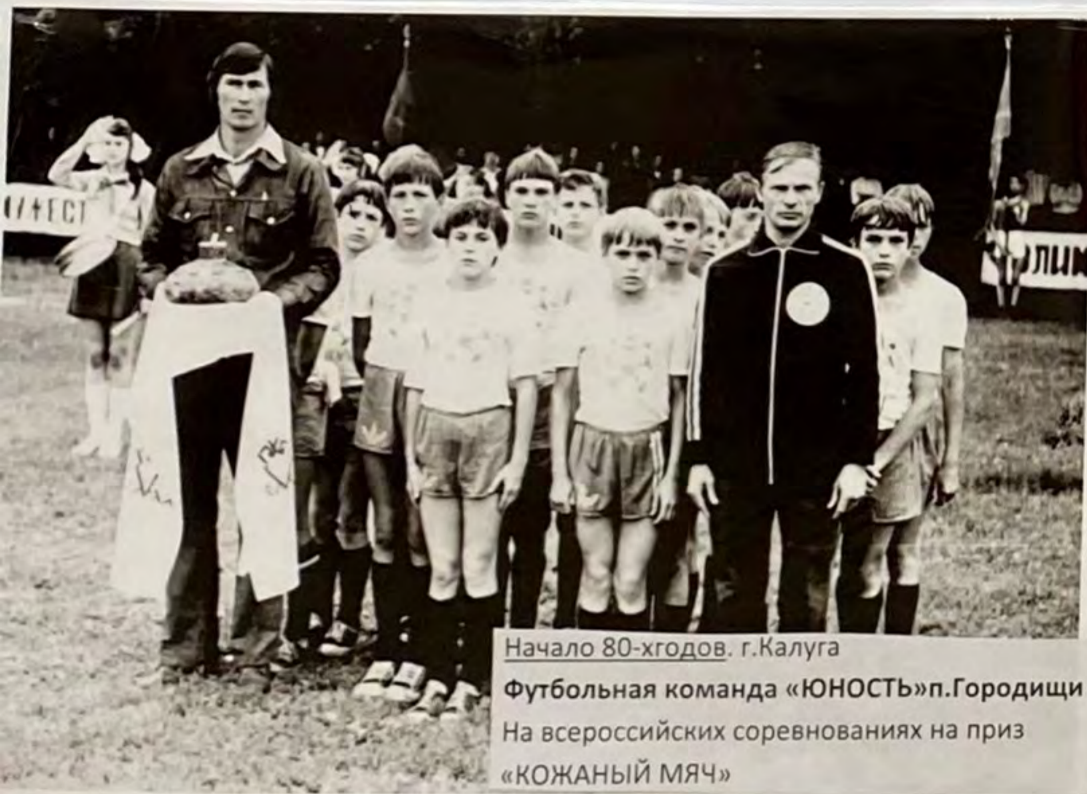
Начало 80-х годов. г. Калуга Футбольная команда «ЮНОСТЬ» п. Городищи На всероссийских соревнованиях на приз «КОЖАНЫЙ МЯЧ»