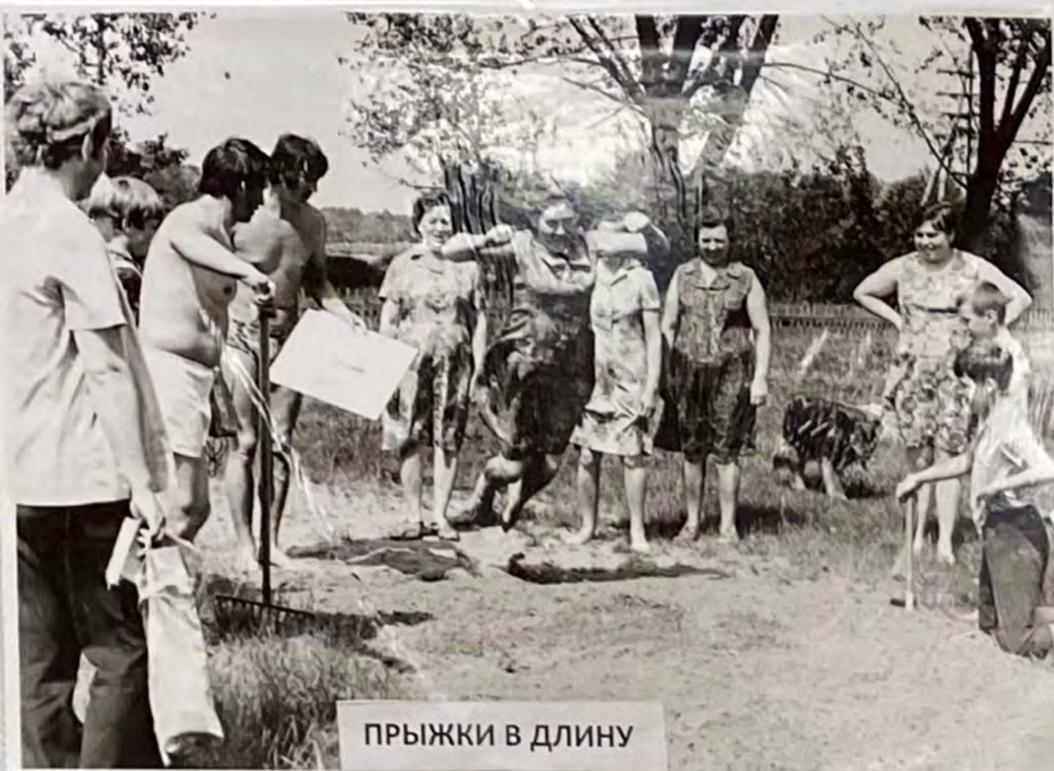
ПРЫЖКИ В ДЛИНУ